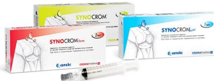
Синокром Croma Farma