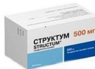
Структум Pierre Fabre